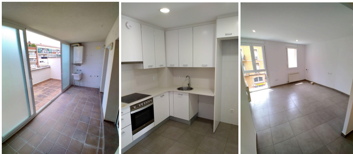
*Imatges de diferents habitatges.