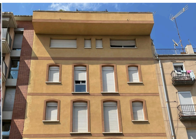
Vista de l'exterior del projecte